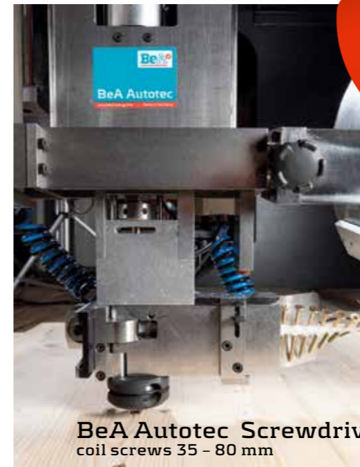
BeA Autotec Screwdriver coil screws 35 - 80 mm