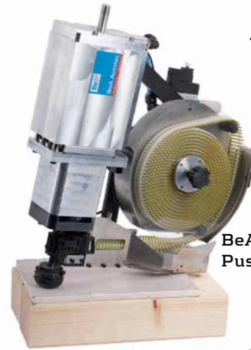
BeA Autotec Pusher tool