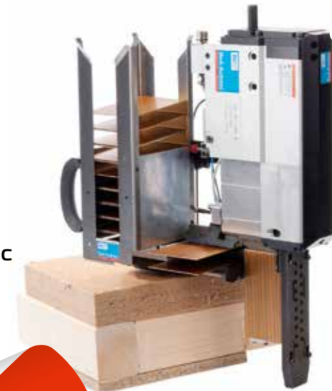
BeA Autotec Cassette tool 246/284 SL